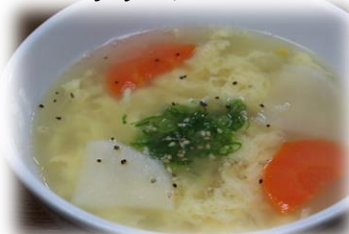
たまごスープ 360円 (税込396円)