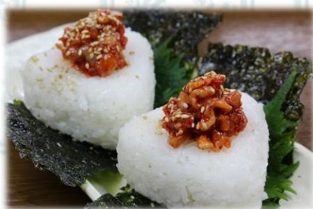
チャンジャおにぎり 550円(税込600円)