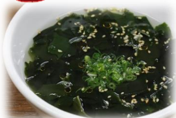
ワカメスープ 350円 (税込385円)