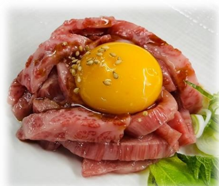
黒毛和牛炙りユッケ