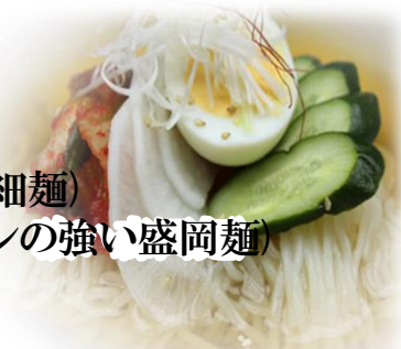
冷麺 (白麺・黒麺) 各880円 (税込968円)