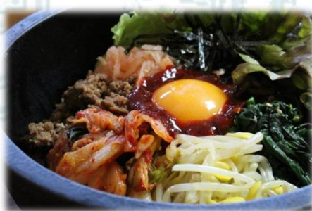
石焼ビビンバ 980円(税込1,078円)