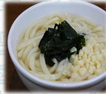
うどん 350円 (税込385円)