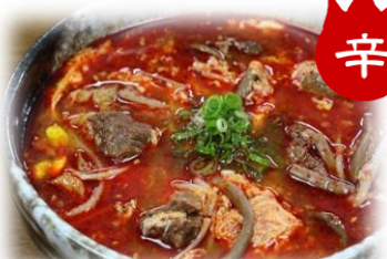
カルビスープ 880円 (税込968円)