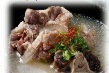
テールスープ 1,000円 (税込1,100円)