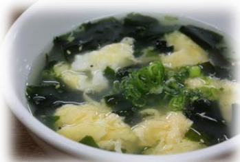
ワカメたまごスープ 430円 (税込473円)