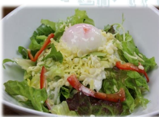
たまチーザーサラダ