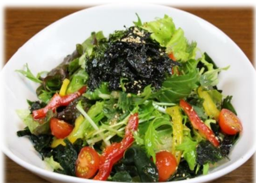
焼肉に合うサラダ