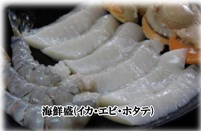
海鮮盛(イカ・エビ・ホタテ)