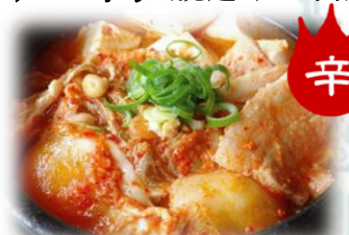
豆腐チゲ 780円 (税込858円)