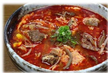
カルビクッパ 980円(税込1,078円)