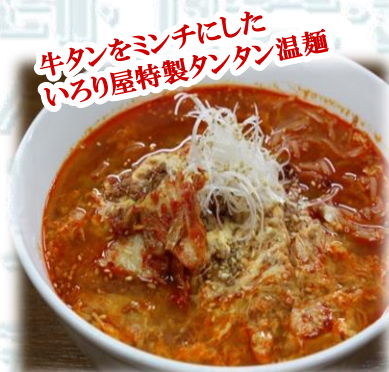
タンタン温麺 880円 (税込968円)